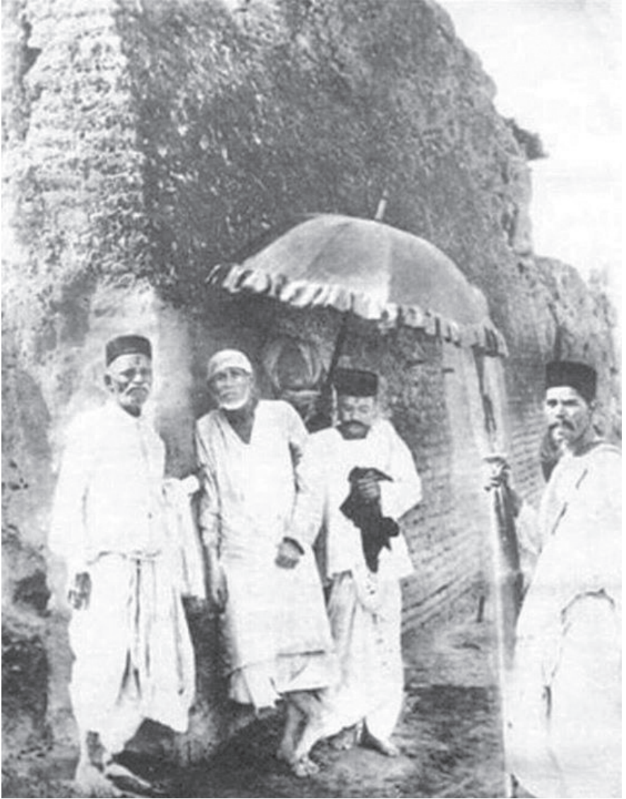
ఓం సాయి నాథాయ నమః: